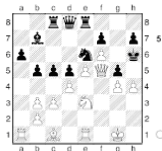
Halen – Bauer. 1959.

As respostas das combinações propostas no mês passado seguem abaixo: