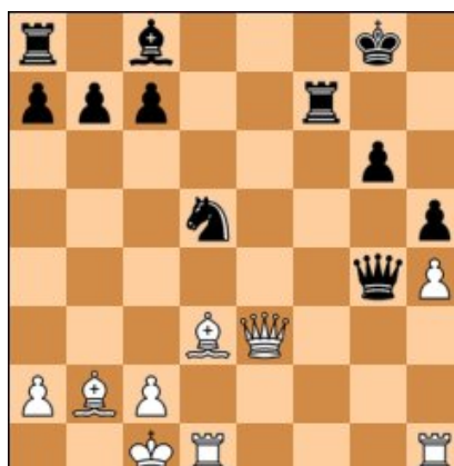
Keres – Petrov, USSR 1940. As brancas jogam.

Segue, abaixo, as respostas das combinações propostas na edição de julho do Informativo: