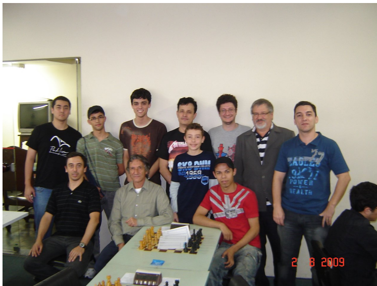
Os sócios do CXC participaram em peso do evento.