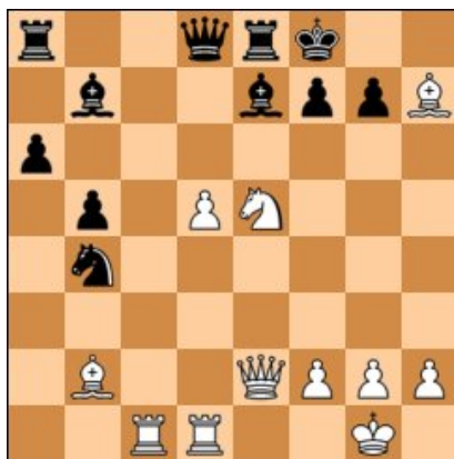
Najdorf – NN, Argentina 1942. As brancas jogam.

Amigos enxadristas, para este mês de agosto temos mais combinações para vocês se divertirem: