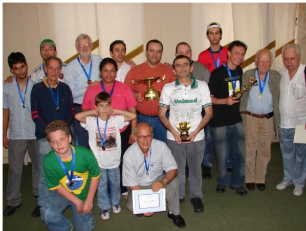
Os ganhadores de prêmio posam para foto.

Segue abaixo duas fotos do encerramento, cedida por Henrique Nemeth: