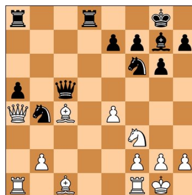
Gilisnki - Spasski. URRS 1952. As brancas jogam.

As respostas das combinações do mês de junho seguem abaixo: