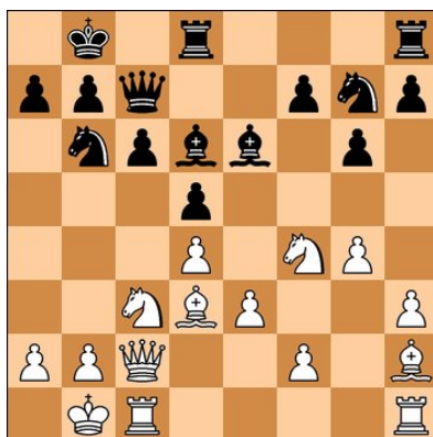
Reshevski - Gligoric. Nova Iorque 1952. As brancas jogam.