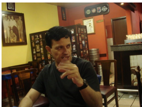
MF Bolívar: 9,5 em 10 no rápido de fevereiro.

Já no rápido, o MF Bolívar dominou os dois grupos, A e B, cedendo apenas um empate em 10 partidas.